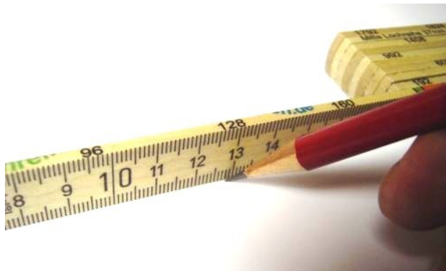
Das Anreißen von Bohrungen

Die Zahlen sind so angebracht, dass man beim genauen Anreißen diese Maße im Auge hat. Der Zollstock liegt einfach hochkant auf dem Werkstück. Auf diese Weise werden Ablesefehler vermieden, da die Zollstock-Skala direkt auf dem Holz aufliegt.